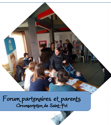
Forum partenaires et parents Circonscription de Saint-Pol