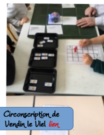
Circonscription de Vendin le Vieil lien

Des enfants cré-actifs dans tous les domaines d'apprentissage