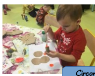
Circonscription de Boulogne 1 lien