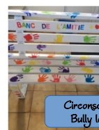
Circonscription de Bully les Mines