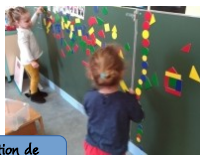
Circonscription de Boulogne 2 lien

Des enfants cré-actifs dans tous les domaines d'apprentissage