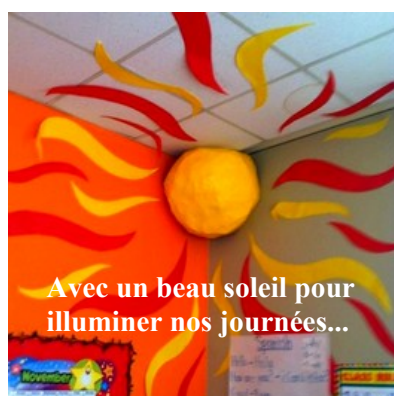
Avec un beau soleil pour illuminer nos journées...

Permettre à chaque élève d'afficher ou d'accrocher ses œuvres plastiques dans la classe, c'est une façon de lui signifier l'importance de sa place au sein du groupe classe.